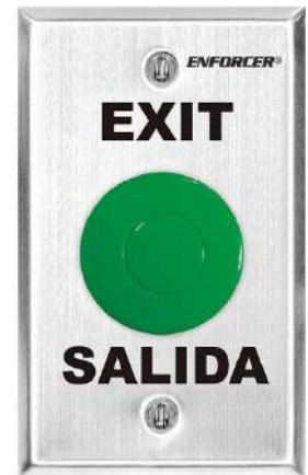
SD-7201GCPE1Q SD-7201GF-PE1Q SD-7201GAPT1Q