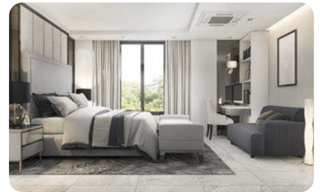
Servicios de Renta Temporal