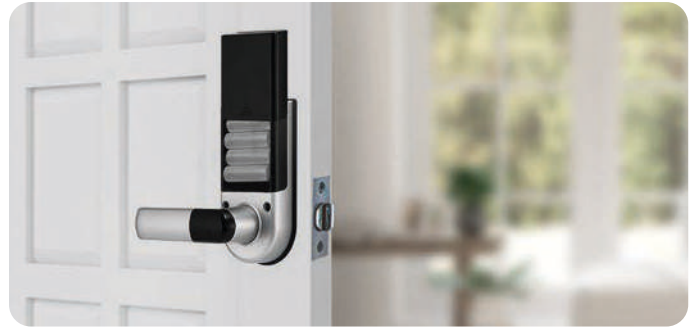
Bajo Consumo de Energía