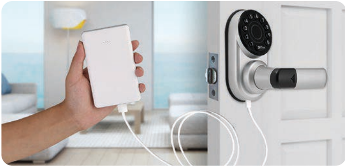
Puerto Micro-USB para Aperturas de Emergencia