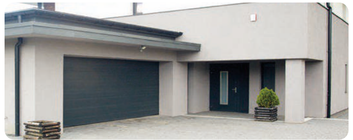
Entradas de Garage (sólo para ML200)*

*No se recomienda la instalación de productos con sensor de huella digital (ML300) en espacios donde el sol o el agua puedan tener un contacto excesivo.